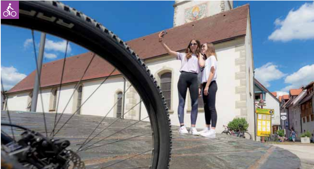
Selkie auf dem Fuhrmannsbrunnen Mengen

Barocke Pracht inmitten von Wiesen und Feldern.